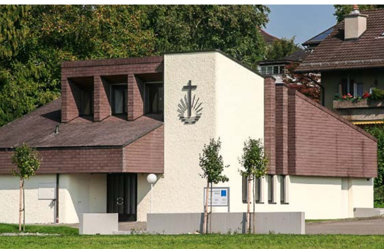
Neuapostolische Kirche Gossau ZH