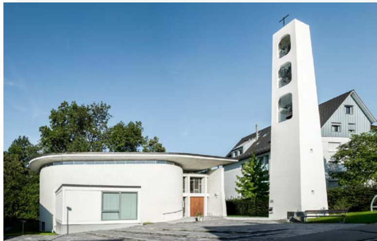
Katholische Kirche Gossau ZH