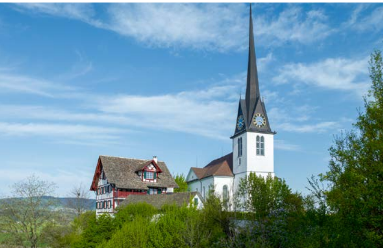
Reformierte Kirche Gossau ZH