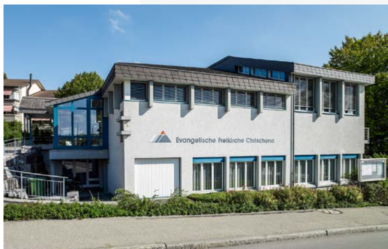
Evangelische Freikirche Chrischona Gossau ZH